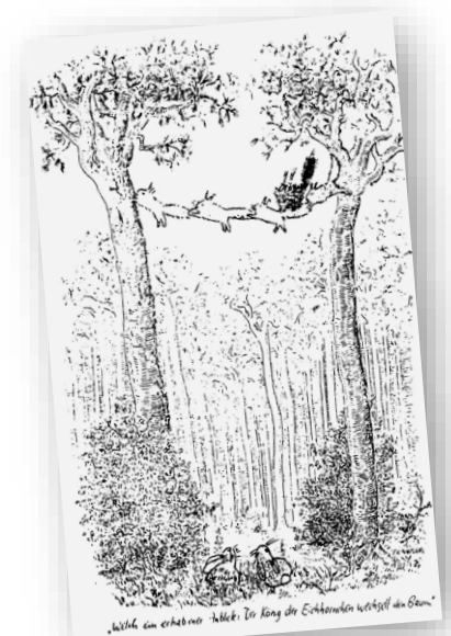
F.K. Waechter: „Welch' ein erhabener Anblick: Der König der Eichhörnchen wechselt den Baum.“

Nun aber ist die Zeit gekommen um Austausch. Ich hoffe, wir bleiben noch etwas beieinander. Laben Sie sich an Speis und Trank; das Büfett ist eröffnet!