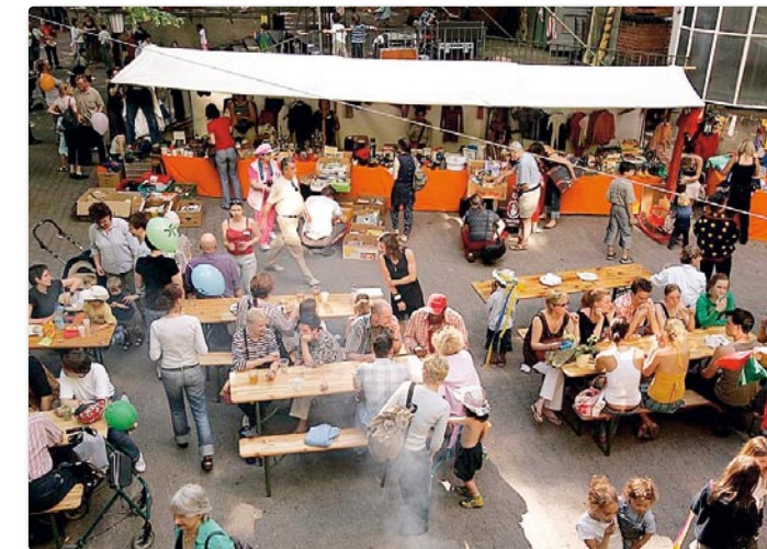
Kleider, Essen, Trinken und viele nette Menschen gibt es auf dem Trödelmarkt

Das aktuelle Programm im Internet www.kiezoase.de